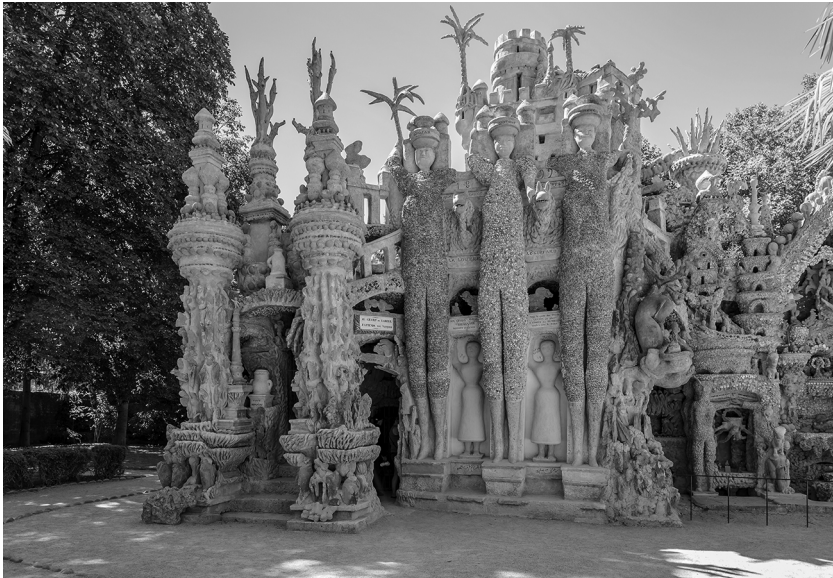
Le « Palais idéal »